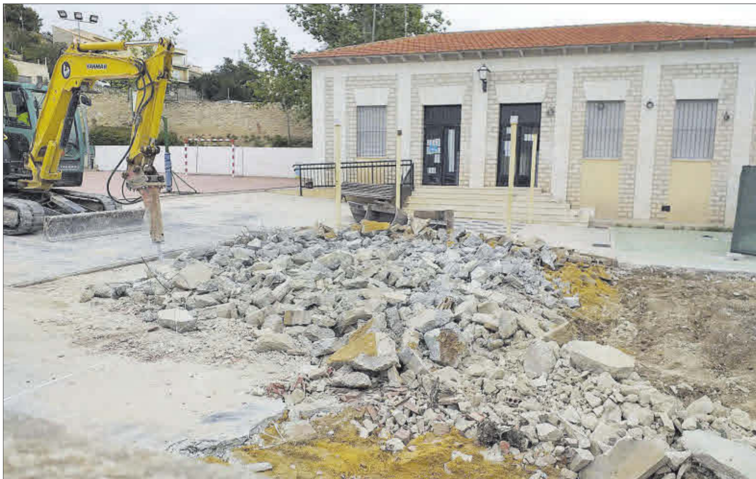
Las obras han arrancado por la construcción del nuevo aula del colegio de Aigües.